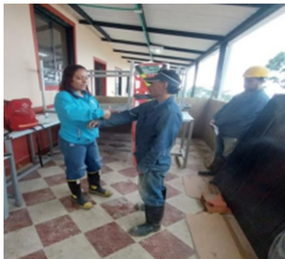
Lugar: Finca Buenavista Fusagasugá. Capacitación primeros auxilios y atención emergencias.