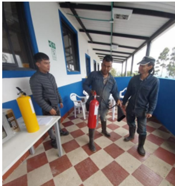
Lugar: Finca Buenavista Fusagasugá. Uso de extintores y atención de conatos de incendio.