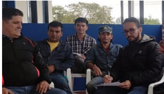
Lugar: Finca Buenavista Fusagasugá. Gestión hídrica, uso eficiente del agua.